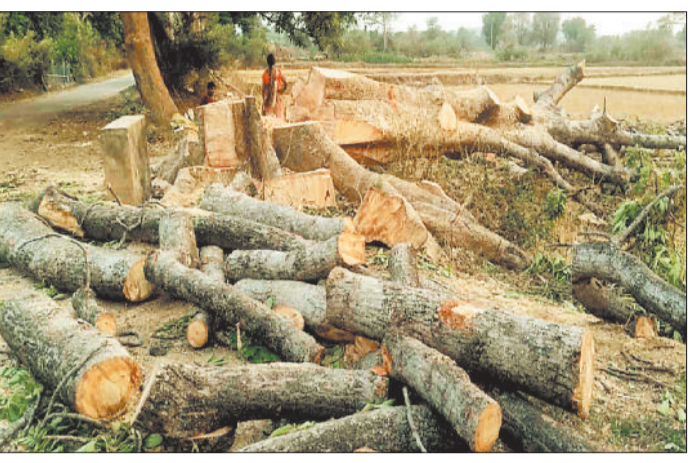
काटे गए सेमर पेड़।

हरिभूमि न्यूज ►► रजपुरीकला लखनपुर क्षेत्र में लकड़ी तस्क़र करने की घटना थमने का नाम नहीं ले रहा। आलम यह है कि क्षेत्र से बड़ी संख्या में नीलगिरी के साथ अन्य प्रजातियों के पेड़ों का काटा जा रहा है। हेरानी की बात तो यह है कि शिकायत के बाद भी किसी का कार्रवाई नहीं होने से लकड़ी तस्क़रों के हासले बुलंद है। ऐसे में बड़ी संख्या में इमारती लकड़ी आसपास के खेत तस्क़र दूसरे राज्यों में खपाया जा रहा है। हालांकि वन विभाग व पुलिस द्वारा पूर्व में अवैध लकड़ी तस्क़र के मामले में कार्रवाई की थी लेकिन अब एक बार फिर क्षेत्र में लकड़ी की तस्क़र सक्रिय हो गए हैं। क्षेत्र के जंगलों से लम्बे समय से लकड़ी की तस्क़र की जा रही है जो आज भी जारी है। तस्क़र जंगल में सक्रिय तो रहते हैं अब गांव के लोगों को मोटी राशि कमाने का झंसा देकर उनके खेतों के मड़ में लगाए गए सेमर काटने लगे हैं। इसके अलावा तस्क़र सड़क किनारे लगे वर्षों पुराने सेमर के पेड़ को बगैर अनुमति काटने लगे हैं। जंगल में पेड़ों की अवैध कटाई पर वन विभाग की टीम ने कुछ हद तक तो अंकुश लगाया है लेकिन ग्रामीणों के खेत किनारे एवं सड़क के आसपास शासकीय भूमि के पेड़ पर अंकुश लगाने में सफल नहीं हो सके हैं। लकड़ी तस्क़र इतने शांति है कि सेमर के अलावा जामुन सहित अन्य प्रजातियों की कीमती पेड़ को भी काटने लगे हैं। लखनपुर क्षेत्र के भरतपुर सहित