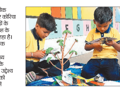
विद्यार्थियों के लिए आभारार्पण कार्यक्रम का आयोजन।