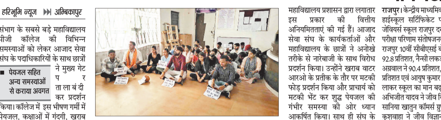
मुख्य गेट पर ताला लगा प्रदर्शन करते छात्र।